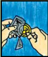
1. Abre con la mano el sobre.

Siempre coloque el condón antes de que el pene toque la vagina, la boca o el ano de la pareja. Verifique que el sobre del condón tenga aire y no esté dañado y que la fecha de vencimiento no esté pasada o que la fecha de fabricación esté dentro de los 5 años de su fabricación.