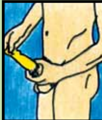
3. Coloca el condón en el pene erecto, colocando la punta del condón para retener el semen, desenróllalo hasta la base del pene.