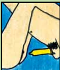
4. Después de la eyaculación, y cuando el pene aún esté erecto, retira el pene, sujetando el condón.