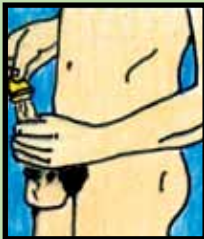
2. Asegura que tiene el lado correcto del condón arriba.